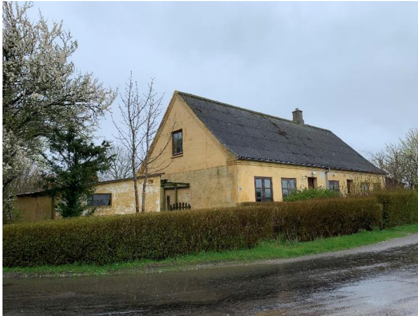
Torvevej 9, 4912 Harpelunde

Murstenshus fra 1910 med tag af fibercement herunder asbest jf. BBR. Ejendommen er jf. BBR 148 m 2 og ligger på en 1.500 m 2 stor grund, hvorpå der også er opført en garage og 2 udhuse.